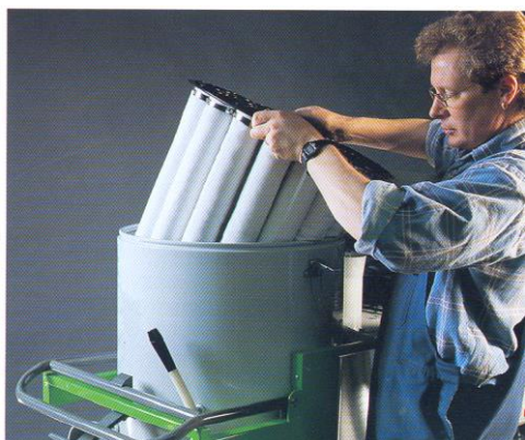
Filtre à manches